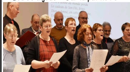
Le groupe « SENTINELLE »