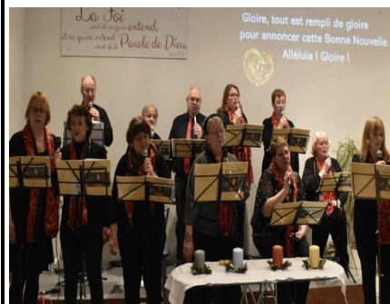
La chorale « Sel et Lumière »

Un grand merci à tous les participants et à notre frère, Noël, pour les photos !